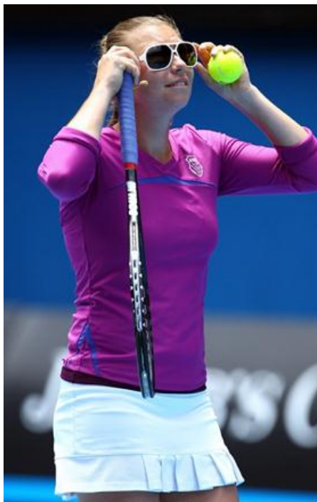
Vera ZVONAREVA (RUSSIE)